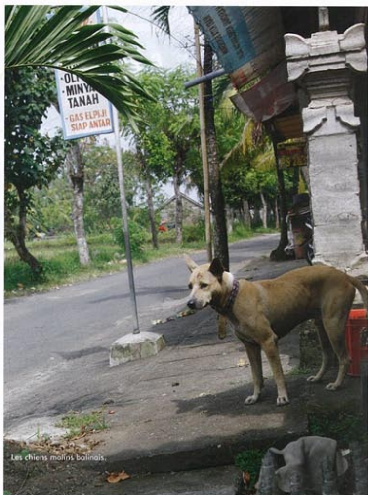
Les chiens malinges balinais.