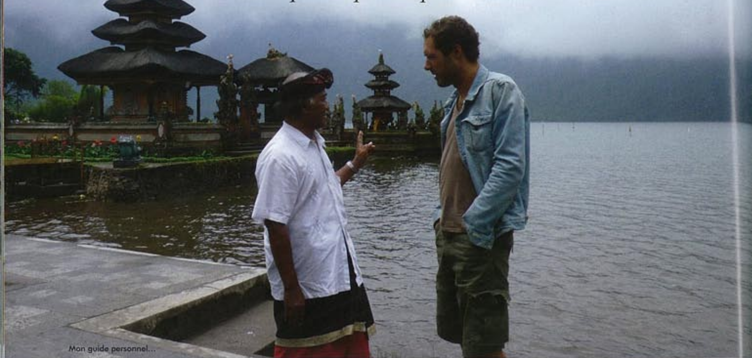
Mon guide personnel...

-C'est qui SHIVA? -C'est le dieu de la destruction. -Pourquoi tu pries le plus méchant?