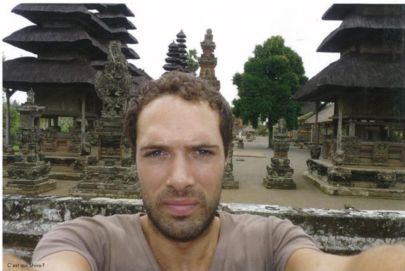
C'est qui Shiva ?

IL Y A VU DES RIZIÈRES ET DES FLEURS, DES CROYANCES JOYEUSES, DES SINGES LIBRES, DES SCOOTERS SANS CASQUE, DES NUITS INSPIRÉES, DES ADMIRATEURS LOINTAINS, DES HÔTELS IMAGINÉS, DU DIOR PEINT À LA MAIN... C'ÉTAIT LOIN DE PARIS, C'ÉTAIT EN INDONÉSIE, RIEN QUE POUR LUI, TRÈS ÈNERVANT ? OUI.