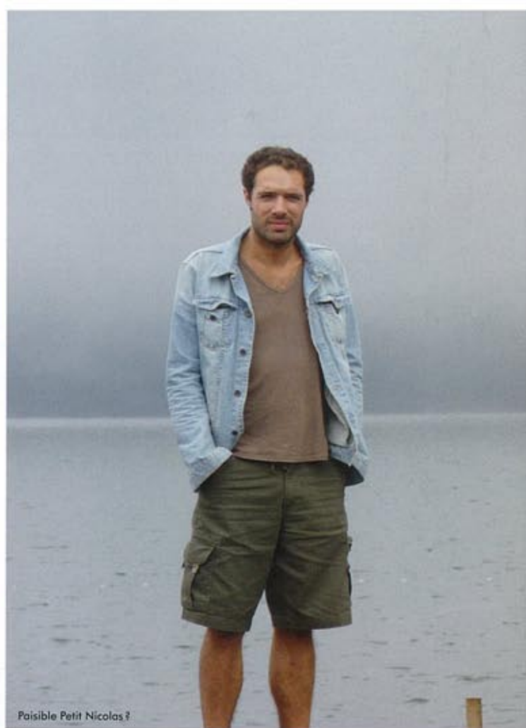
Paisible Petit Nicolas ?