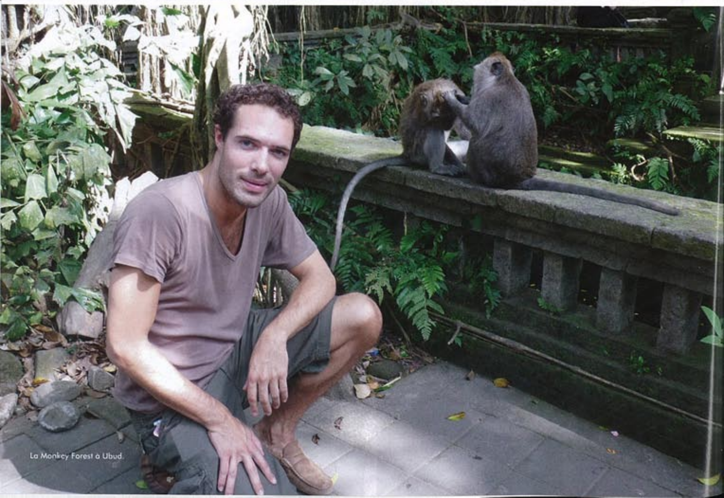
La Monkey Forest à Ubud.