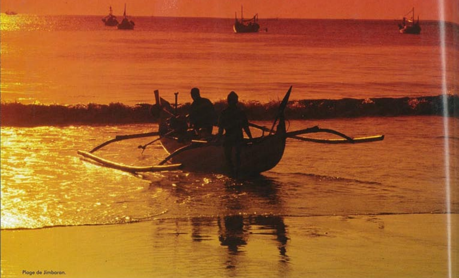
Plage de Jimbaran.