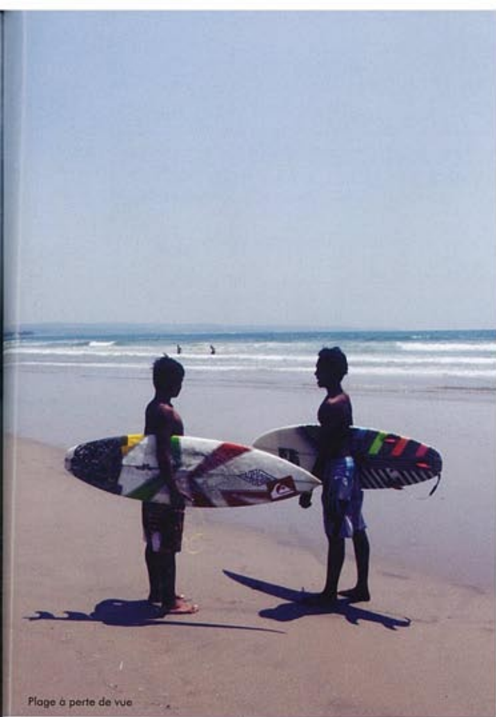
Plage à perte de vue