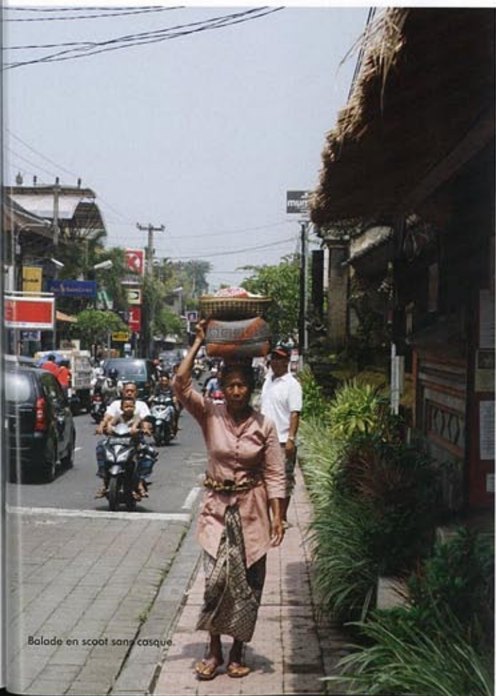
Balade en scoot sans casque.