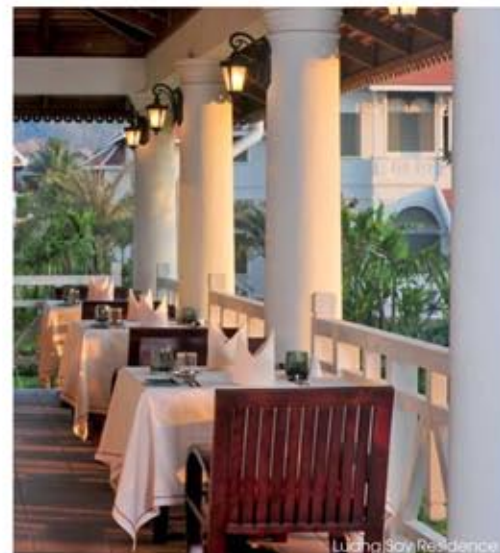
Luang Say Residence