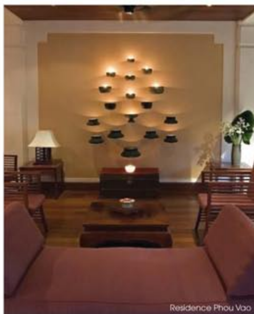
Residence Phou Vao

La richesse culturelle et la beauté des lieux n'auront pas échappé à Jean-Paul Chantraine, PDG de l'agence Asia, spécialiste s'il en est de l'Asie. Depuis près de 30 ans qu'il a découvert la région, il y a enchaîné les projets. Le plus récent et le plus luxueux fut la construction de la Résidence Luang Say dans un style mêlant esprit colonial et éléments architecturaux indochinois. Membre des Small Luxury Hotels of the