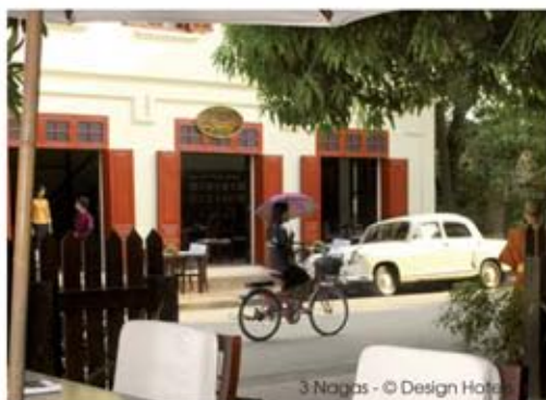
3 Nagas