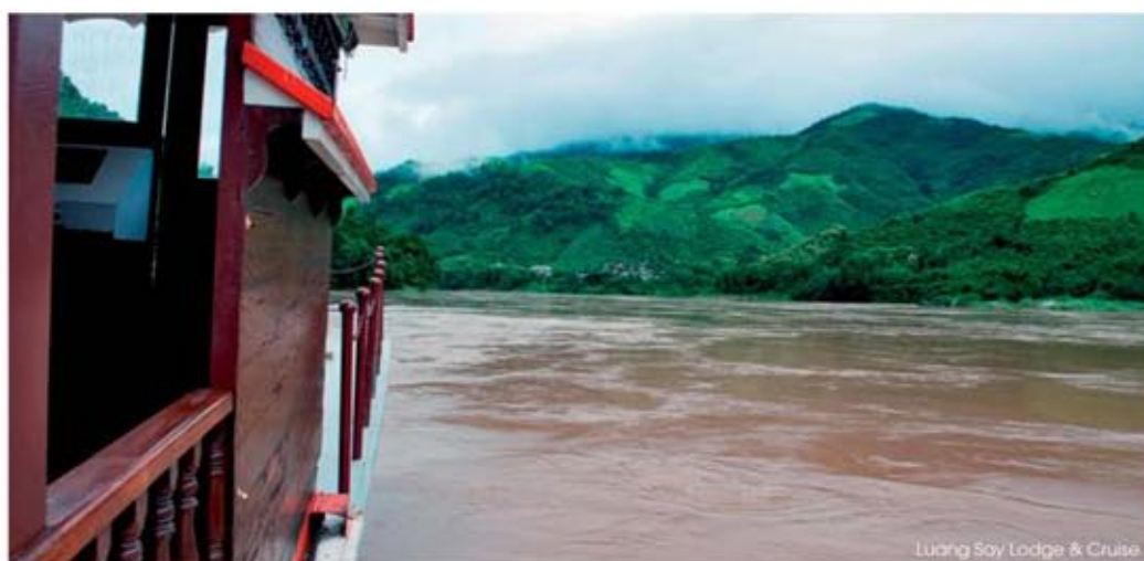
Luang Soy Lodge & Cruise