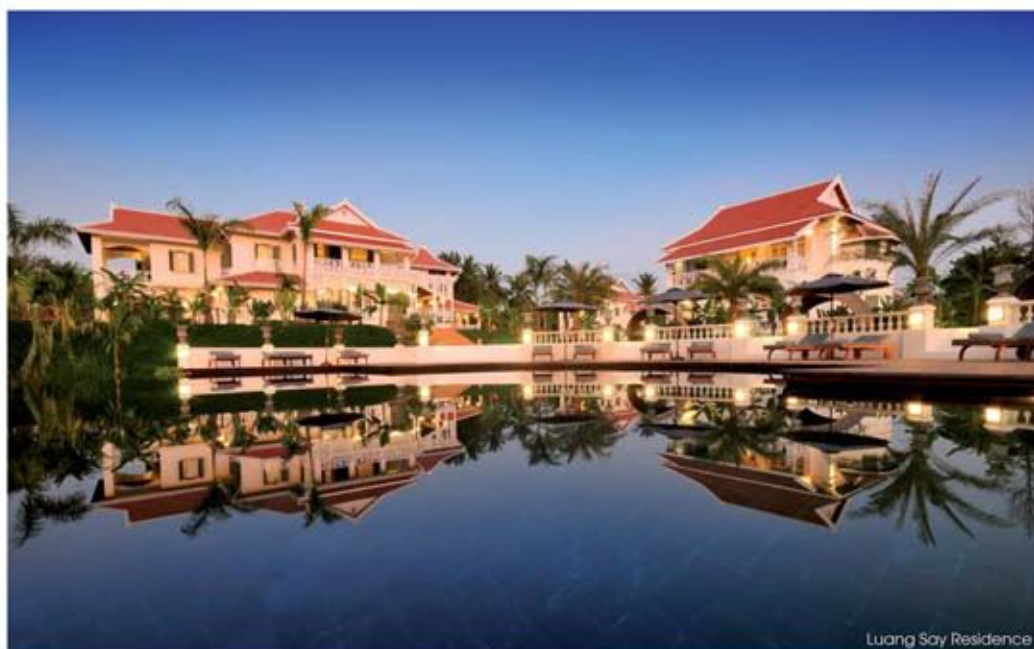
Luang Say Residence

In a more historical vein, guests will be delighted with the Maison Souvannaphoum, which also