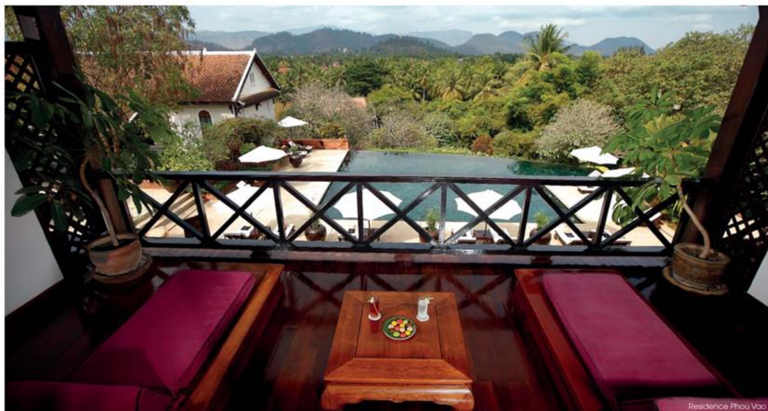
Residence Phou Vao

Autre établissement de renom, la Résidence Phou Vao, propriété du groupe Orient Express Hotels depuis 2006. Installée sur les hauteurs, vous embrasserez du regard l'ensemble de la ville et les vallées plantées de palmiers au pied des montagnes. Trois hectares de jardins luxuriants servent d'écrin aux 32 chambres et 2 suites réparties entre quatre bâtiments à l'architecture traditionnelle laotienne. La décoration fait honneur au bois de rose, au teck et aux tissus locaux. Une vaste piscine à débordement permet de se détendre et de se rafraîchir après une balade en ville. Le spa propose une gamme de soins à base de produits conçus à partir de plantes, fruits et fleurs cultivés dans des jardins biologiques laotiens. À découvrir, par exemple, le Mohom, un soin régénérant faisant appel à la plante de l'indigo réputée pour ses vertus anti-inflammatoires. La restauration décline saveurs lao traditionnelles émaillées de touches occidentales. Des cours de cuisine organisés sur simple demande vous livreront les secrets de la préparation du poisson du Mékong, grillé ou cuit à la vapeur. Plus exotique, la visite des marchés vous permettra de découvrir insectes grillés, plantes inconnues, algues du Mékong séchées, couenne de buffle et cubes de sang caillé... Les âmes sensibles préféreront sans doute les marchés destinés à l'artisanat des cultures Hmong et autres ethnies habitant des provinces voisines.