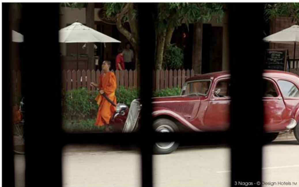
3 Nagas