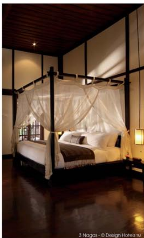
3 Nagas