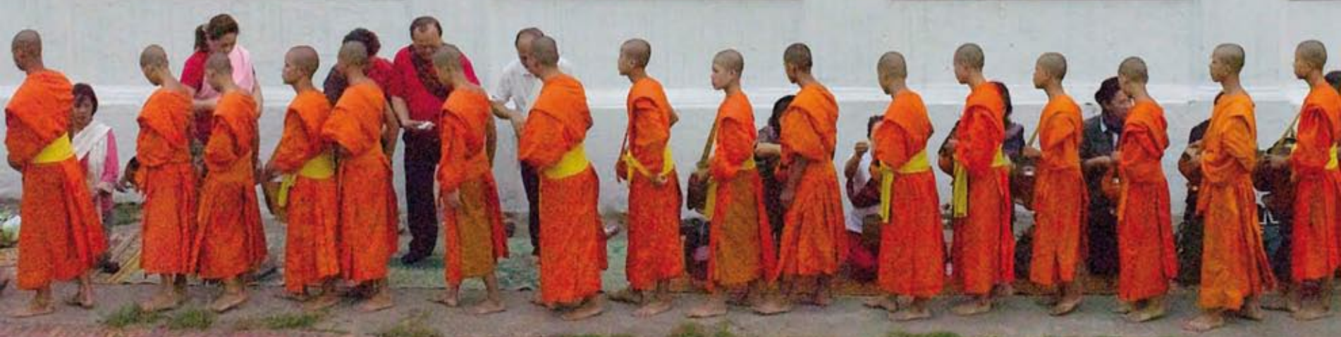
Tok Bat - Cérémonie des offrandes aux moines