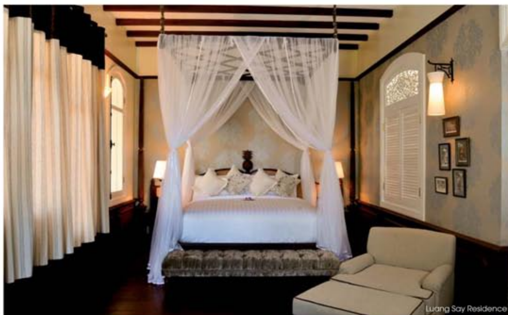
Luang Say Residence