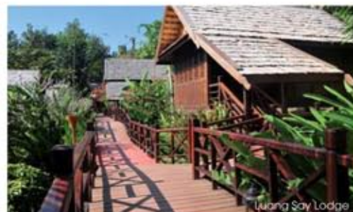
Luang Say Lodge

Each hotel has its own soul, history, ambiance, style and philosophy, inspiring visitors (not "guests") to make new, exciting discoveries each time they come. LLP: you may not stay there for ever, but you will want to go back, again and again!