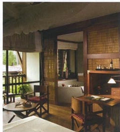
Ci-dessus : Les chambres de la Résidence d'Angkor, toutes parées de soie, coton et bambou, distillent un parfum de voyage d'une autre ère.

Pour sa septième édition, le festival photo le plus prisé de la région place la barre très haut. Invités de prestige, ateliers, projections dans des lieux emblématiques, du 19 au 26 novembre 2011.