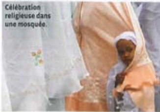
Célébration religieuse dans une mosquée.

► D'Omah Déjeuner dans un des patios enchanteurs de cet hôtel composé d'un labyrinthe d'anciennes demeures javanaises, mariant antiquités et art contemporain, dans un village sur la route de l'océan Indien. Plats à partir de 5 €. Tembl, Jalan Parangtritis km 8,5, Bantul, Yogyakarta, (+62)-274-368-050. ► Gajah Wong Au bord d'une des rivières qui traversent la ville, à l'ombre des frangipaniers, orchestre de gamelan, cuisine javanaise raffinée (canard au riz au safran, poulet au lait de coco...). À partir de 6 € le plat. Jalan Gejayan, Condongcatur, (+62)-274-588-294.