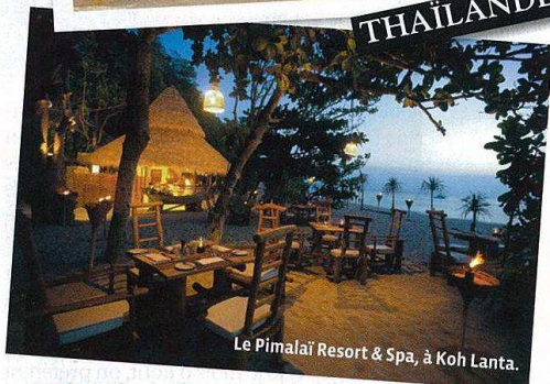
Le Pimalai Resort & Spa, à Koh Lanta.